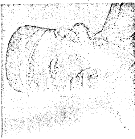
MAYOR HUBERT MATOS, líder de la revolución cubrista, encarcelado por Fidel desde hace 15 años.